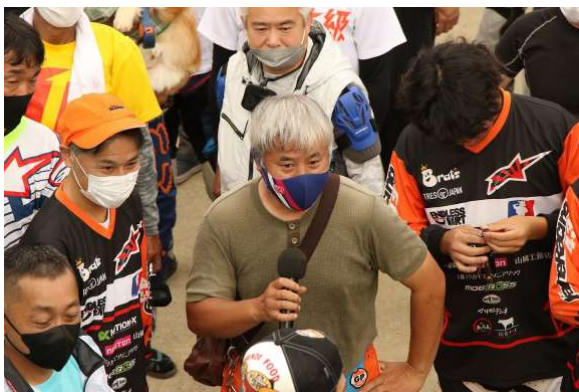
▲唯一のロクフェス皆勤賞。あざす！！

そんなロクフェス14のレースの内容については、MCおやじちゃんにお願いしましょう。